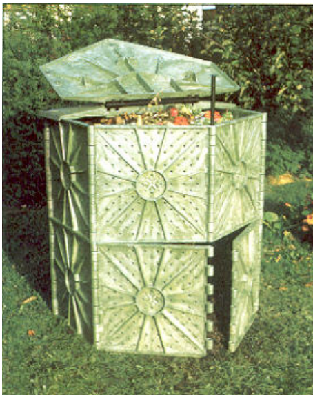
Thermokomposter, 750 l